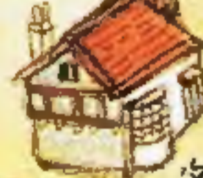
مخينة بريس بيلاك